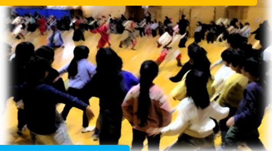
くじらぐもを みんなで つくりました。