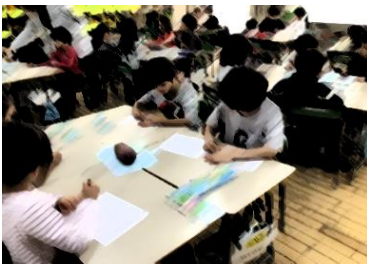
図工『えのぐのいろを まぜてみよう』