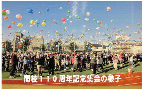
開校110周年記念集会の様子