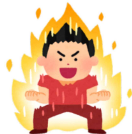
チャレンジするぞー！！

学校がチャレンジする場(チャンス)を作り、子供たちはチャレンジしていく。それが成功、失敗であっても子供たちは変容していく(チェンジ)。特に失敗は人を強くし、失敗を繰り返さないために自ら考える。これらがとても大切だと思います。子供たちが、失敗を恐れずに何かにチャレンジ、挑戦する勇気を育てるとともに、この「挑戦づくり」を学校が後押ししていきます。